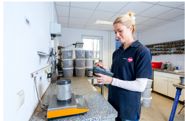
Datenerfassung mit Handheld